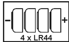
Obr. 5.1. Správné umístění baterií

Pozor na polaritu (+/-) baterií. Baterie umístěte do zařízení podle obrázku 5.1.